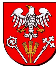
Starosta Powiatu Pułtusk

Uprzejmie zapraszamy Państwa do udziału w konferencji naukowej „Wychowanie dla Pokoju – konteksty, wyzwania i perspektywy doby globalnej”. Celem planowanej konferencji jest stworzenie interdyscyplinarnego forum umożliwiającego podjęcie dyskusji nad współczesnymi problemami Wychowania dla Pokoju oraz kształtowania kultury pokoju w obszarach kształcenia, wychowania i socjalizacji ze szczególnym uwzględnieniem kontekstów skali globalnej i lokalnej.